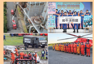
■ 表紙 本号掲載記事より